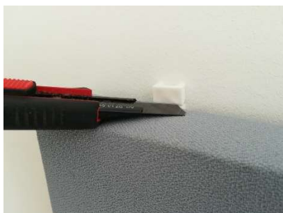
Überstand mit Cutter einkürzen