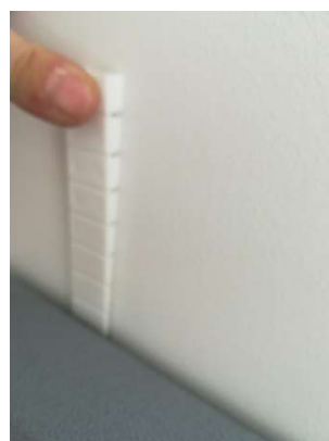
Kunststoffkeil von oben zwischen Wand und Paneel schieben