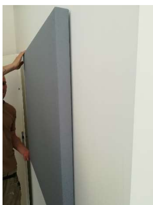
Hängen Sie das Wandpaneel von oben in die Halterungen